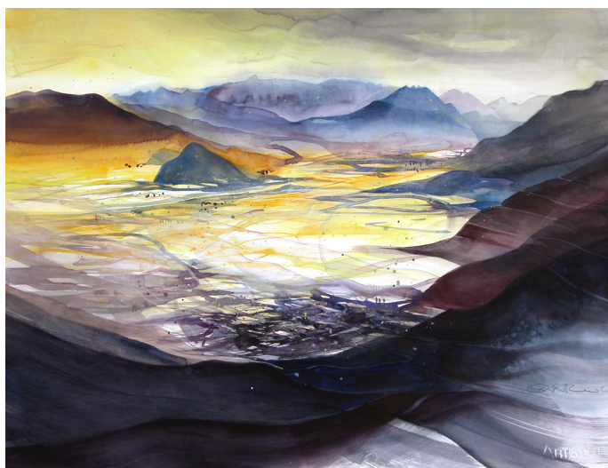
Das Rheintal vom St. Anton