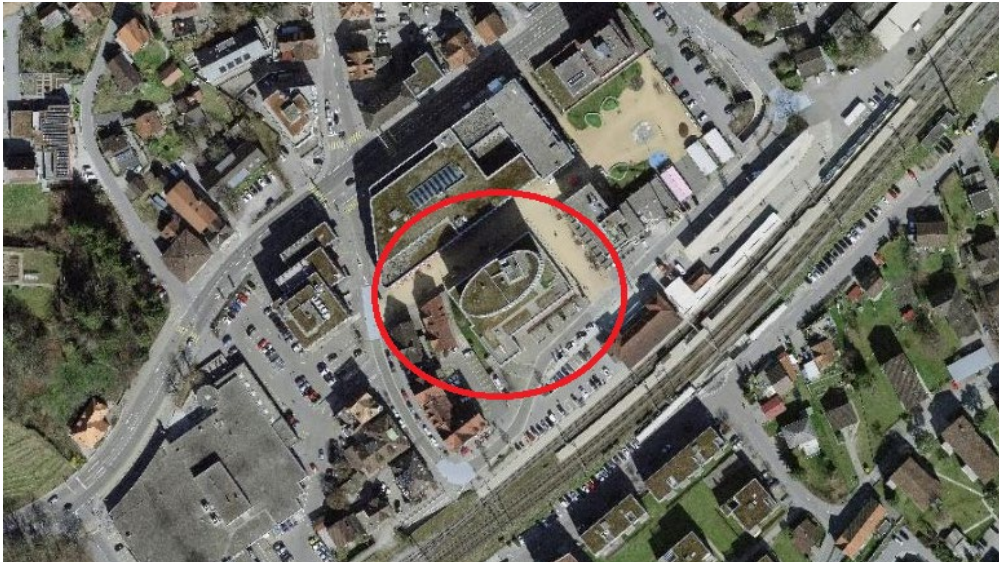
Abbildung 1: Lage des Planungsgebiets

Das Planungsgebiet befindet sich angrenzend an den Bahnhof Heerbrugg, in der politischen Gemeinde Au. Es umfasst ein bereits bestehendes Gebäude (Assek.-Nr. 2782), wobei dieses 2008 konstruiert wurde und in der Parzelle Nr. 1866 aufzufinden ist. Die totale Fläche des Grundstücks umfasst 1'945 m 2 und ist aufgrund der Lage Teil des Zentrum Heerbruggs. Gemäss des rechtskräftigen Zonenplan ist das Grundstück in einer Kernzone K4 angesiedelt. Dabei wird der Sockel des Gebäudes gewerblich genutzt, während die Geschosse darüber (Ellipse) einer Wohnnutzung dienen. Drei Seiten des Gebäudes werden durch gewerbliche Nutzungen begrenzt. Im Süden ist der Bahnhof Heerbrugg das begrenzende Element.