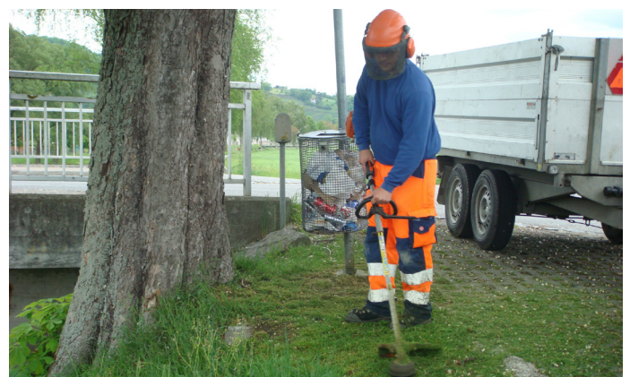
Fachfrau/Fachmann Betriebsunterhalt EFZ