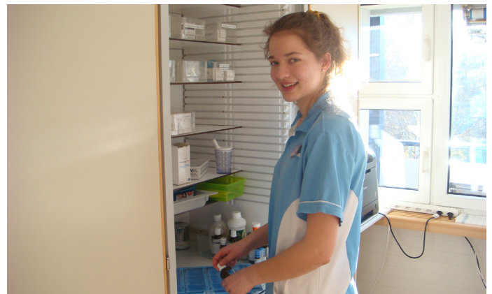
Fachfrau/Fachmann Gesundheit EFZ