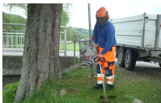
Die Gemeinde Au bietet vielseitige und interessante Lehrstellen in verschiedenen Berufsfeldern an.