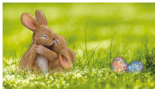
Osterhasen mit Ostereier

Der Gemeinderat und das Personal wünschen Ihnen frohe Ostern und viel Vergnügen bei der Suche nach den «Osternästli».