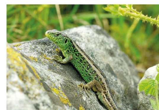
Zauneidechse im Naturgarten