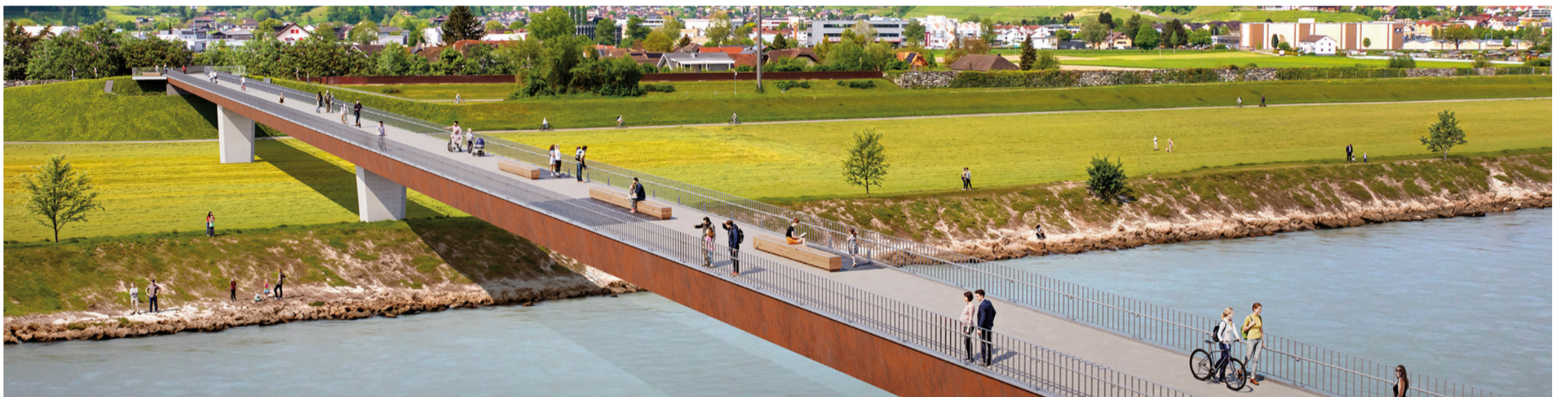
Fuss- und Veloverkehrsbrücke Au-Lustenau, Visualisierung